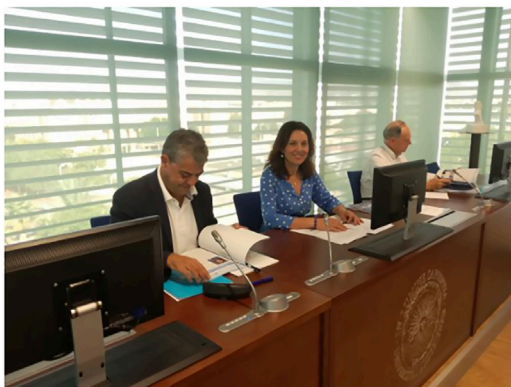
Un informe de cuentas que da fe de la buena salud financiera de la Universidad de Almería y de su excelente gestión económica.