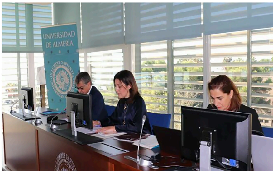
El Consejo Social apoya la actividad investigadora y cultural de la Universidad.