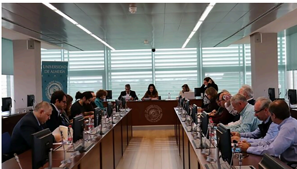
Pleno del Consejo Social de la Universidad de Almería del pasado martes 26 de marzo