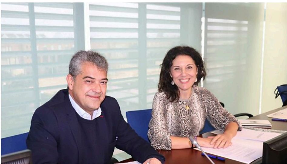
La UAL eleva su presupuesto para 2020 en un 2% hasta los 103,3 millones