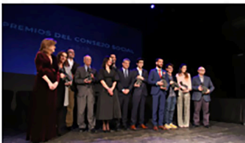
El Consejo Social premió anoche a docentes, alumnos y empresas en el Teatro Cervantes.

© El Consejo Social proyecta la labor de quienes hacen la vida más fácil