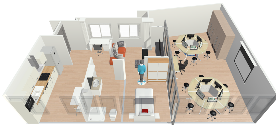
Fig 1. Recreación 3D del laboratorio Smart Home

Desde la DGCIS se comprometen a ayudarnos en la medida de sus posibilidades, de tal forma, que a finales de 2017 prevén cumplir los 3 primeros puntos y el resto para el primer trimestre de 2018, de tal forma, a mediados de segundo cuatrimestre se pueda proceder a instalar sensores y los kits adquiridos para el Master TAI. Una vez que el laboratorio Smart Home esté completamente operativo se realizará una presentación a los medios de comunicación.