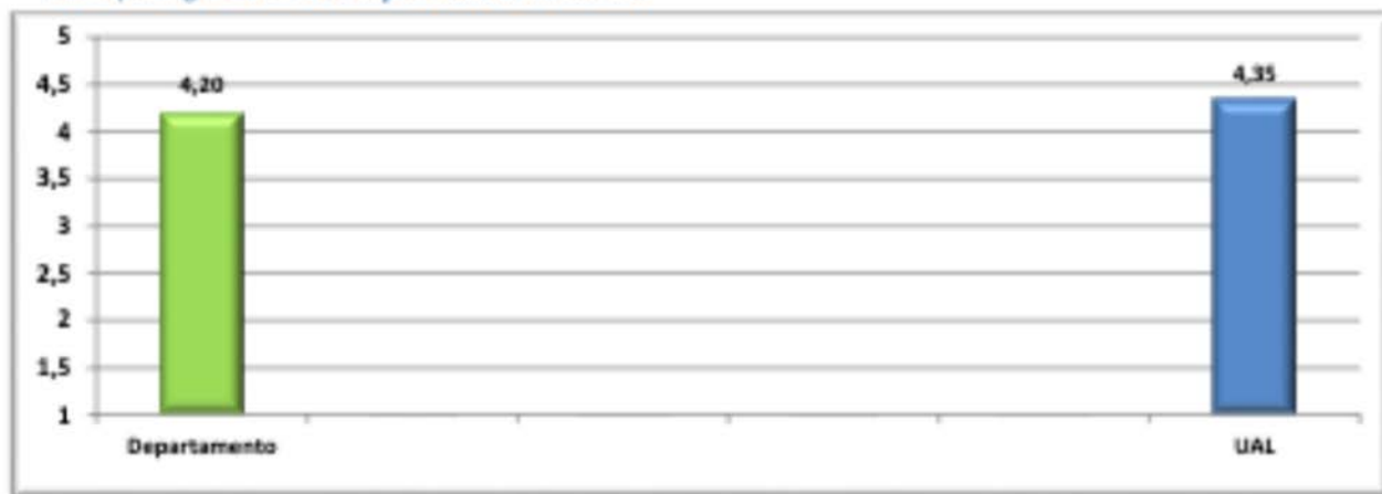
Descripción gráfica de la comparativa de resultados