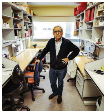
Ginés Morata en el Centro de Biología Molecular.