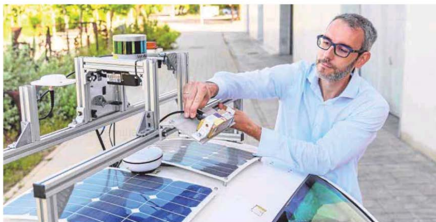
◀ Ganador. El profesor ha sido ganador del premio Jóvenes Investigadores del Consejo Social.

El ganador del premio Jóvenes Investigadores del Consejo Social de la UAL es Ingeniero en Telecomunicaciones por la Universidad de Málaga (año 2005), universidad en la que se doctoró en 2009 con mención de doctorado europeo. Es autor de más de 100 publicaciones (33 artículos en revistas indexadas JCR, dos libros y 50 contribuciones a congresos nacionales e internacionales, con un h-index de 29 y más de 3000 citas a sus trabajos según Google Scholar a fecha de junio de 2020).